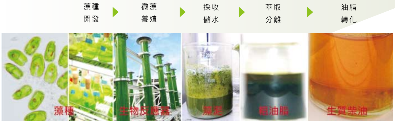
圖3 微藻生質柴油生產的程序示意圖。