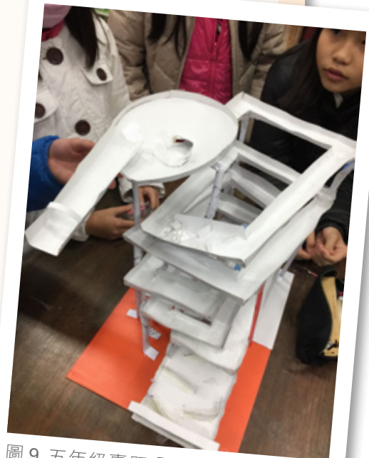
圖9. 五年級專題「緩降彈珠軌道」成品發表