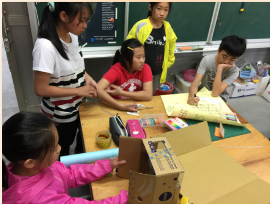
圖 5. 小組討論製作方法與海報繪製