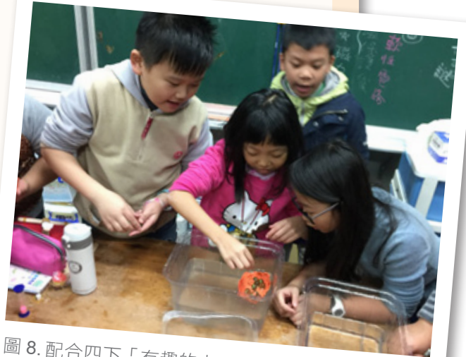
圖8. 配合四下「有趣的力」單元製作黏土船，並進行載重測試