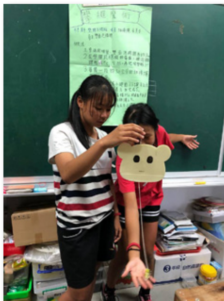
圖 7. 專題發表與科學遊戲演示