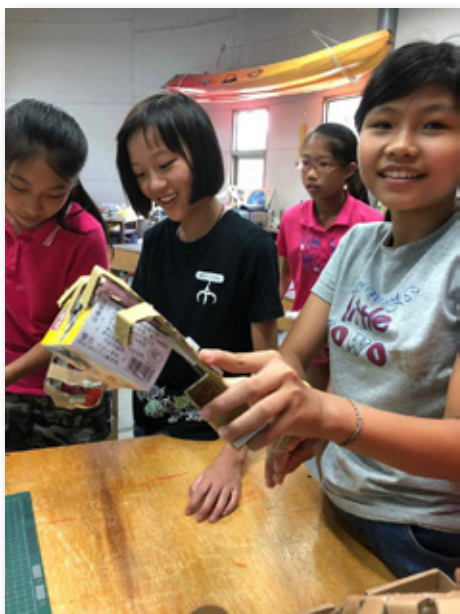
圖 6. 測試瓦楞紙機械手臂是否能順利夾取盒子