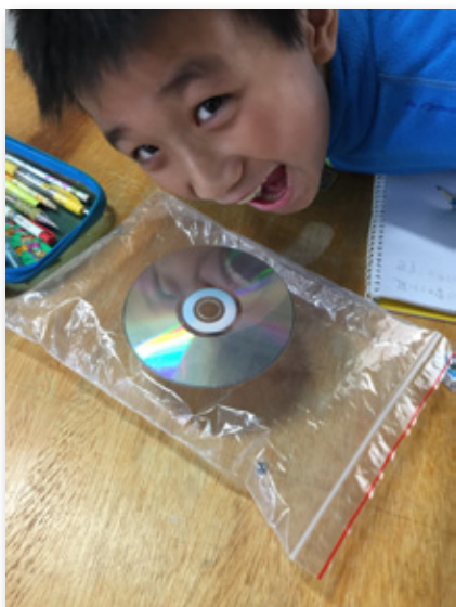
圖 10. 配合三上「空氣和風」單元製作 CD 氣墊船

看到每個小朋友在自然課中找到自己喜歡的單元，怎能不感到鼓舞與欣慰呢？實施近一年來，小朋友一改過去對於自然課的刻板印象，期待著上自然課，自然教室連下課時都很熱鬧，呈現了另一種自然課的風景，當聽到孩子們一句「我喜歡自然課！」，