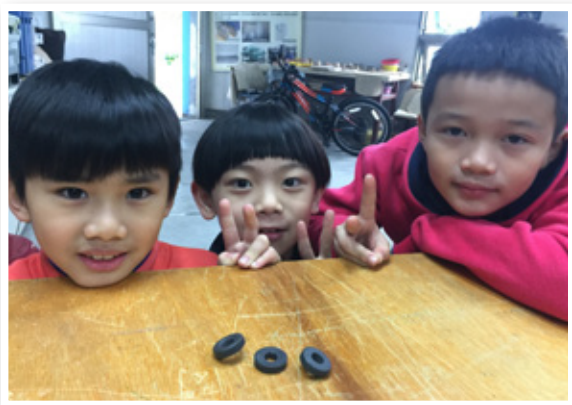
圖 2. 配合三上「奇妙的磁鐵」單元，挑戰磁鐵擂台賽

觀摩： 公布專題題目後，透過「阿魯米玩科學」FB 粉絲頁，介紹和專題相關的影片。以機械手臂為例，上完五年級下學期「動物大觀園」單元，利用阿魯米玩科學 FB 粉絲頁查詢「機械手臂」，可以查到好幾則相關的影片（圖 3），接著讓小朋友看影片，並告知如何檢索影片，看完影片後自由發問，最後以個人或小組方式進行討論。