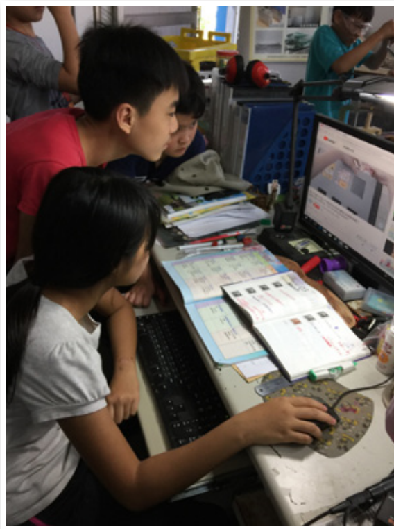
圖 3. 利用電腦觀看網路影片，了解製作方法

仿作： 根據網路上的影片，小朋友可以隨時上網查看製作方法，繪製設計圖，並進行材料的收集及試做（圖 5）。做出原型後，比對專題中所設定的任務，試試達成任務的可能性再做修改。「瓦楞紙機械手臂」設定的任務達成目標為第一階手指可彎曲、伸展；第二階可握住鋁罐並抬