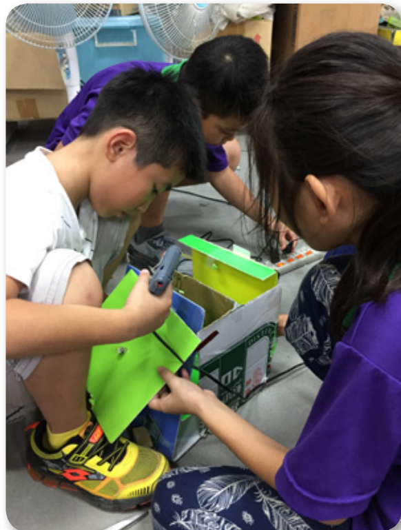
圖 1. 配合四上「燈泡亮了」單元，小組合作製作娃娃屋

將科學遊戲融入實驗小學自然課中，有幾點優勢。首先是延伸了課本的知識框架，讓小朋友可以透過科學遊戲接觸到比原課本內更多的學理。第二個是增加動手做的機會，驗證學習內容，活用知識，增進解決問題的能力（圖 1）。第三點是增加了學生的學習興趣，連不喜歡自然的小朋友都願意專心聽課、發問與討論。第四點是小組合作完成專題的默契變得更好，還能凸顯個人在小組中的特色，及獲得互相學習的機會。第五點是專題發表讓小朋友