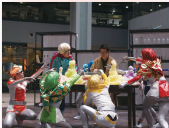
圖 3.「夢遊魔幻化境」的科學舞劇場景