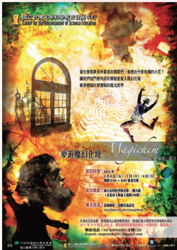
圖 2.「夢遊魔幻化境」的科學舞劇海報