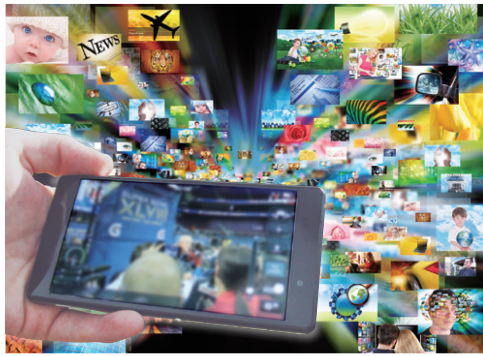
圖 4. 行動網路即時選點節目是未來的學習趨勢

際網路服務 (over the top, OTT)、行動通訊載體 (mobile 3C device) 等軟硬體的多方匯合 (圖 4)，未來教育必須正視為即時教育傳播新內容的產出設立新目標。如果想像為什麼這麼多人喜歡看各種世界級國際賽會轉播、名人現場專訪、重大國際事件……，即時掌握第一手的知識就成為學習不可或缺的一環。如果專業的知識有賴長期學術研究來產生，即時到位的知識轉譯就壓縮了學習的時效，是極具潛力的教育傳播市場。